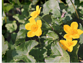
T. 2. Caltha palustris