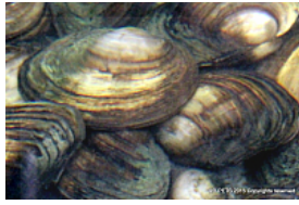
T. 2. Anodonta anatina