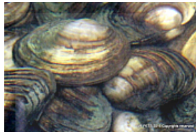
T. 2. Anodonta anatina