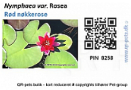
T. 2. Pictogram