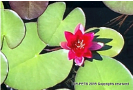
T. 2. Nymphaea var. rosea