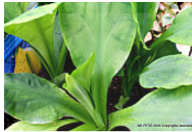
T. 2. Lysichiton americanus