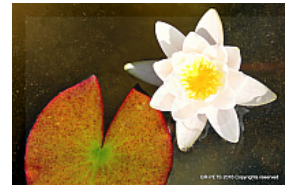
T. 2. Nymphaea alba