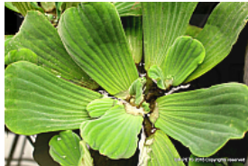
T. 2. Pistia stratiotes