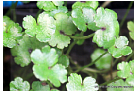
T. 2. Hydrocotyle nova ze...