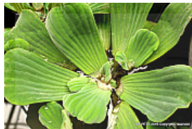
T. 2. Pistia stratiotes