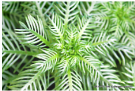
T. 2. Hottonia palustris