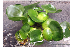
T. 2. Eichhornia crassipes