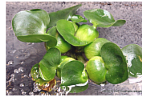
T. 2. Eichhornia crassipes