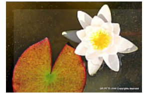
T. 2. Nymphaea alba