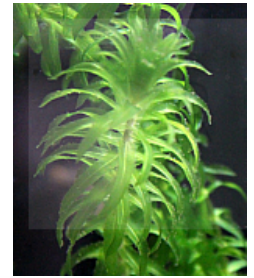
T. 2. Elodea densa