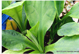
T. 2. Lysichiton americanus